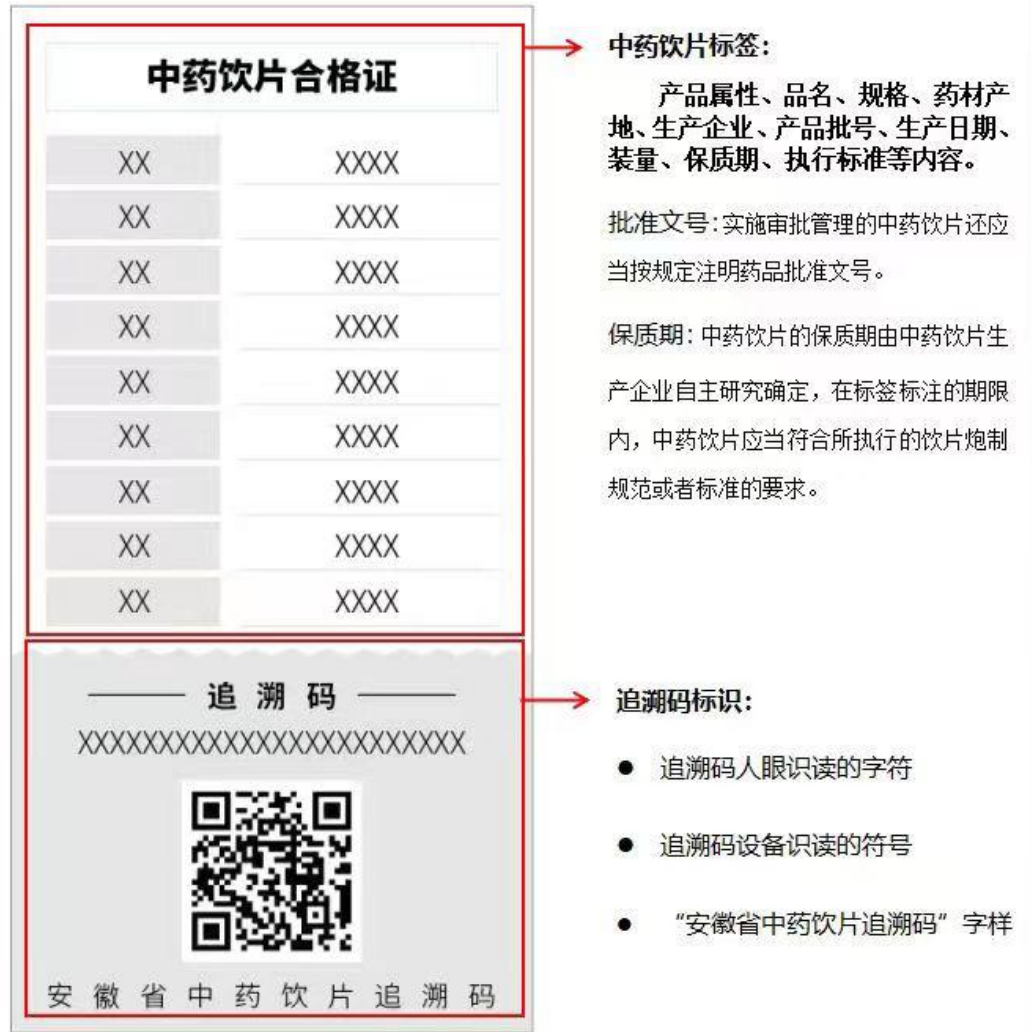
图 1 中药饮片追溯码标识示例